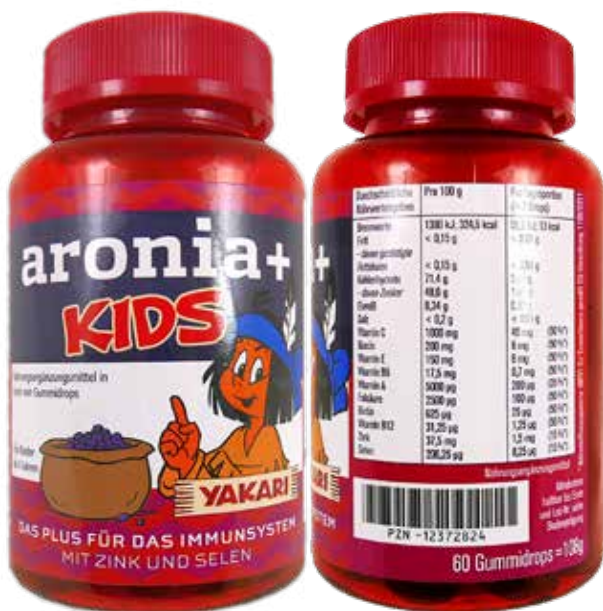
Abbildung 6: Beispiel aus der Apotheke für Abbildungen, die Kinder ansprechen, auf der Verpackung (aronia+ KIDS). Die vom BfR vorgeschlagene maximale Höchstmenge von 200 µg Vitamin A pro Tag in Nahrungsergänzungsmitteln (gilt für die Altersgruppe ab 15 Jahren) wird erreicht [22].

Acht Verpackungen enthalten – bereits von außen erkennbar – Kinder ansprechende Tabletten oder Fruchtgummis, zum Beispiel in Form von Bärchen oder Rennautos. Besonders auffällig ist die Sammelaktion bei dem Produkt „Orthomol junior Omega plus“: Werden ausreichend Coupons abgegeben, verspricht der Hersteller eine kleine Überraschung – natürlich nur bei gleichzeitiger Angabe persönlicher Daten. Aus Sicht der Verbraucherzentralen ist es kritikwürdig, wenn Kinder durch gezielte Marketingaktionen wie eine Mitgliedschaft in einem „Junior-Club“ frühzeitig an Nahrungsergänzungsmittel herangeführt werden. (Abb. 7).