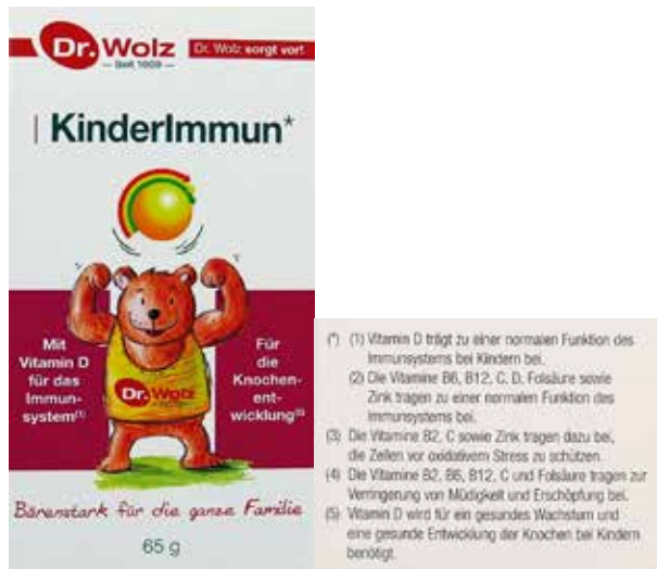
Abbildung 11: Aus Sicht der Verbraucherzentralen unzulässige gesundheitsbezogene Angabe auf der Schau-seite (Kinderimmun Dr. Wolz)