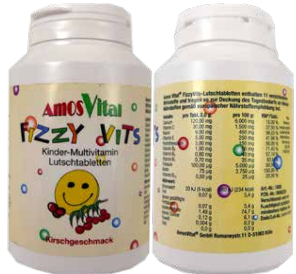
Abbildung 5: Zusammensetzung eines Nahrungsergänzungsmittels aus der Apotheke (Amos Vital FIZZY VITS Kinder-Multivitamin Lutschtabletten), das NICHT in der Datenbank des BVL hinterlegt ist (Anzeigepflicht gemäß § 5 der Nahrungsergänzungsmittelverordnung). Bei einer Tagesdosis von zwei Lutschtabletten wird die vom BfR vorgeschlagene maximale Höchstmenge von 200 µg Folsäure pro Tag in Nahrungsergänzungsmitteln (gilt für die Altersgruppe ab 15 Jahren) erreicht [22].

Nahrungsergänzungsmittel sind aus rechtlicher Sicht Lebensmittel und müssen kein Zulassungsverfahren durchlaufen. Sie müssen vor dem Inverkehrbringen lediglich beim Bundesamt für Verbraucherschutz und Lebensmittelsicherheit (BVL) angezeigt werden. Es genügt dafür, den Namen des Produktes und des Verantwortlichen (Hersteller, Händler oder Importeur) zu benennen sowie ein Muster des Etiketts beizufügen. Dieser Anzeigepflicht nach Paragraph 5 der Verordnung über Nahrungsergänzungsmittel (NemV) sind einige Hersteller nicht nachgekommen. Eine Nachfrage beim BVL ergab, dass vier der insgesamt 26 Produkte (15 Prozent) nicht in der Datenbank des BVL gelistet waren (Anhang 1). Diese Produkte dürften nicht auf dem Markt sein. Dazu gehören auch die „Amos Vital FIZZY VITS Kinder-Multivitamin Lutschtabletten“ aus der Apotheke, die bei fast allen enthaltenen Vitaminen und Mineralstoffen die D-A-CH-Referenzwerte überschreiten (Abb. 5).