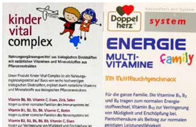
Abbildung 12: Aus Sicht der Verbraucherzentralen unzulässige gesundheitsbezogene Angabe (GSE Kinder Vital Complex und Doppelherz® system ENERGIE Multivitamin family)

Bei einigen Produkten wurde die zulässige Aussage „trägt zur Verringerung von Müdigkeit und Ermüdung bei“ verstärkt, indem der Begriff „Ermüdung“ durch „Erschöpfung“ ausgetauscht wurde (Abb. 12).