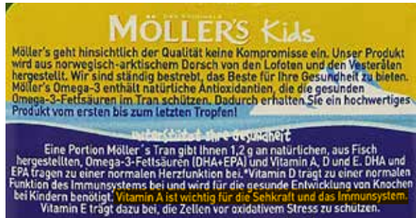
Abbildung 10: Aus Sicht der Verbraucherzentralen unzulässige gesundheitsbezogene Angabe (Das Originale Möllers Omega-3 Kids)