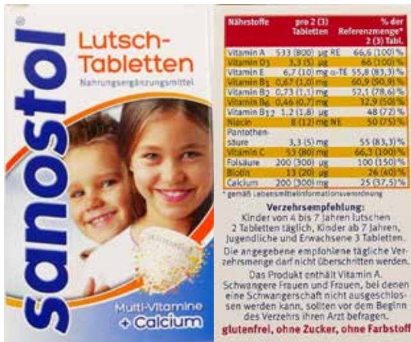
Abbildung 4: Zusammensetzung eines Nahrungsergänzungsmittels aus der Apotheke mit sehr hoher empfohlener Tagesdosis an Vitamin A, das für Kinder ab vier Jahren bestimmt ist (sanostol® Lutschtabletten). Die vom BfR vorgeschlagene maximale Höchstmenge von 200 µg Vitamin A pro Tag in Nahrungsergänzungsmitteln (gilt für die Altersgruppe ab 15 Jahren) wird deutlich überschritten. Bei einem Verzehr von täglich drei Tabletten für Kinder ab sieben Jahren, wie der Hersteller empfiehlt, ist der BfR-Wert sogar um das Vierfache überschritten [22].