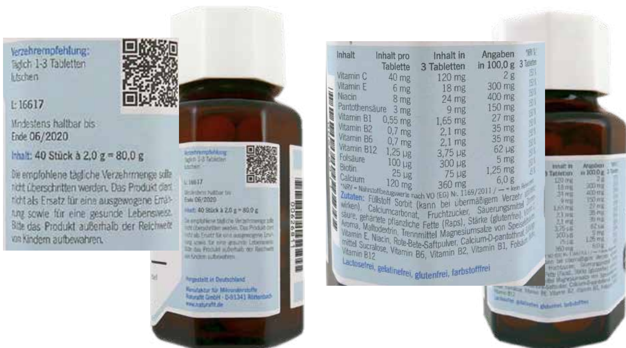
Abbildung 2: Zusammensetzung eines Nahrungsergänzungsmittels aus der Apotheke mit unspezifischer Verzehrempfehlung des Herstellers (naturaft Kindervitamine mit Calcium). Bei einer Tagesdosis von drei Tabletten wird die vom BfR vorgeschlagene Höchstmenge von 200 µg Folsäure pro Tag in Nahrungsergänzungsmitteln (gilt für die Altersgruppe ab 15 Jahren) überschritten [22].