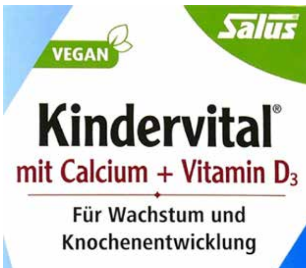
Abbildung 9: Aus Sicht der Verbraucherzentralen unzulässige gesundheitsbezogene Angabe (Salus Kindervital® Spezial-Tonikum)