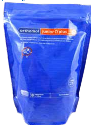
Abbildung 14: Teuerstes Produkt des Marktchecks (Orthomol junior Omega plus)

Bei der Berechnung der Kosten für Nahrungsergänzungsmittel für Kinder fielen deutliche Unterschiede auf. Die Preisspanne der erfassten Produkte reichte von 0,04 Euro bis zu 1,43 Euro pro vom Hersteller empfohlener Tagesdosis. Im Durchschnitt müssen Verwenderinnen und Verwender dieser Produkte mit Ausgaben von 0,54 Euro pro Tag bzw. rund 198 Euro pro Jahr rechnen. Das teuerste Produkt des Marktchecks schlägt bei täglicher Anwendung im Jahr mit stolzen 522 Euro zu Buche (Abb. 14).