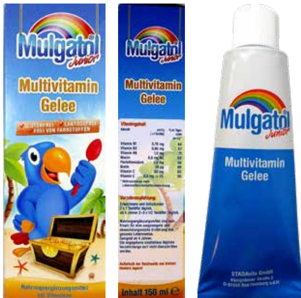
Abbildung 3: Zusammensetzung und Verzehrempfehlung eines Nahrungsergänzungsmittels aus der Apotheke, das eine exakte Dosierung erschwert (Mulgatol® Junior Gelee). Um das Gel abzumessen, wird lediglich auf einen Teelöffel verwiesen, ein Dosierlöffel fehlt.

Insgesamt haben 22 der 26 Produkte (85 Prozent) bei bestimmungsgemäßem Gebrauch entsprechend der Verzehrempfehlungen bei mindestens einem Vitamin oder Mineralstoff die D-A-CH-Referenzwerte für Kinder im Alter von vier bis sieben Jahren überschritten ( Anhang 1 ) – bis hin zu Überschreitungen bei sämtlichen Vitaminen und Mineralstoffen innerhalb eines Produktes (Mulgatol® Junior Gelee). Hinzu kommt, dass bei diesem Nahrungsergänzungsmittel eine exakte Dosierung und Einhaltung der Verzehrempfehlung schwierig ist. Um das Gel abzumessen, wird lediglich auf einen Teelöffel verwiesen, ein Dosierlöffel fehlt ( Abb. 3 ). Die für Kinder angebotenen Nahrungsergänzungen überschritten die D-A-CH-Referenzwerte für Kinder im Alter von vier bis sieben Jahren am häufigsten bei Vitamin C, Vitamin B 6 sowie Biotin und Vitamin E ( Anhang 1 ).