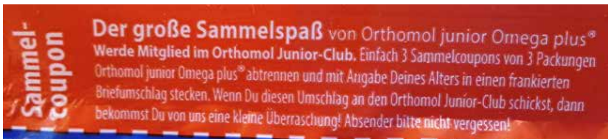
Abbildung 7: Beispiel einer Sammelaktion bei einem Nahrungsergänzungsmittel (Orthomol junior Omega plus)

Zehn von 26 Produkten kommen ganz ohne gesundheitsbezogene Angaben aus. Auf den anderen 16 Produkten wurden insgesamt 171 gesundheitsbezogene Angaben gefunden (durchschnittlich 10,7 Angaben pro Produkt). Die meisten gesundheitsbezogenen Angaben waren auf der Rückseite des jeweiligen Produktes zu finden.